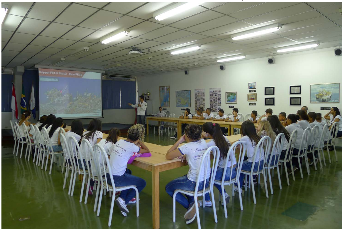
Visita guiada faz parte do projeto Sementes para o Amanhã, da Secretaria Municipal de Educação

A lunos do 9º ano da Escola Municipal Coronel João Pedro de Almeida, do Camorim, participaram na última quarta-feira, 13, do programa Passe Adiante, do estaleiro Brasfels. A visita foi realizada em parceria com a Prefeitura de Angra, por meio do projeto Sementes para o Amanhã, da Secretaria de Educação, Ciência e