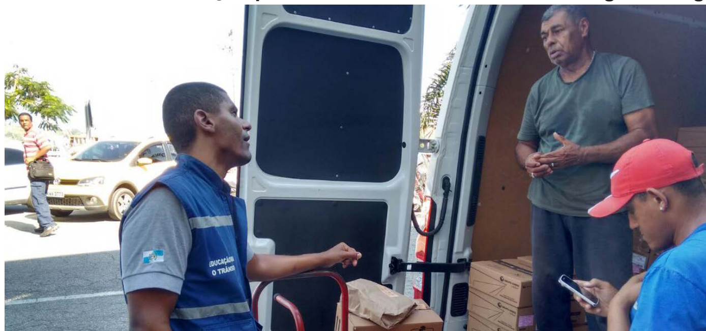
Orientação para motoristas é sobre o uso da vaga de carga e descarga

Um dos principais problemas no trânsito da região central de Angra