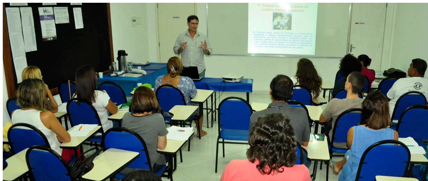
Teatro para servidores e Organização do trabalho no setor público também são oferecidos neste mês

Os parâmetros básicos dos atos de gestão são: a realização do planejamento e controle;