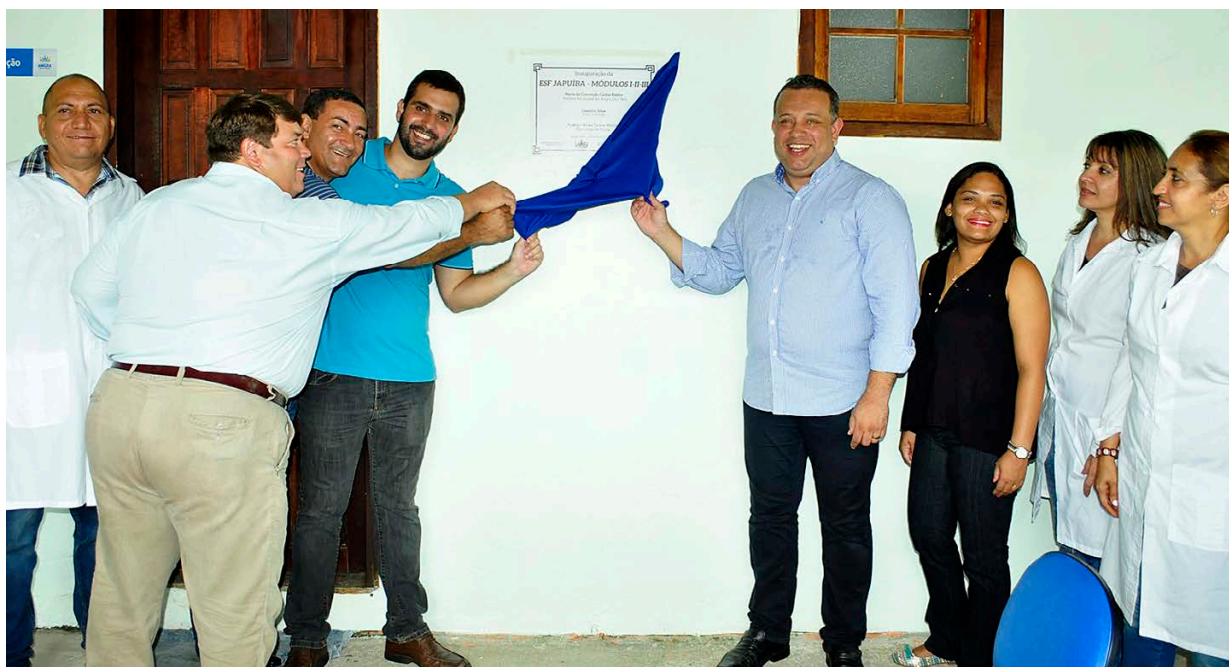
Unidade funciona na rua Cabo Frio e será um importante instrumento para a atenção básica

A Prefeitura de Angra dos Reis, por meio da Secretaria de Saúde, inaugurou na manhã de segunda-feira, 22, as novas instalações da Estratégia de Saúde da Família