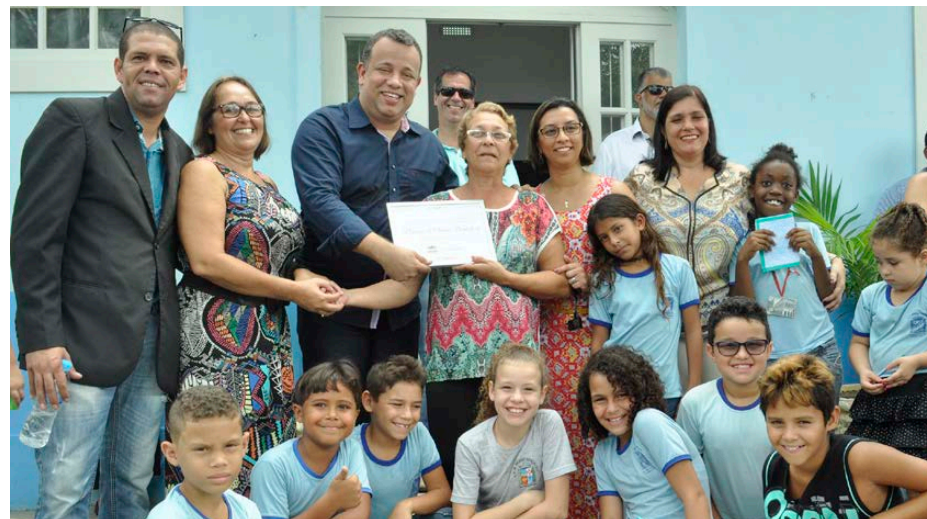
Veículos foram adquiridos com a verba destinada pelo Ministério da Saúde

A Prefeitura de Angra dos Reis, por meio da Secretaria de Saúde, recebeu na terça-feira, 22, três veículos que auxiliarão no combate à dengue no município. Um carro foi entregue na solenidade e outros dois serão entregues no próximo mês. A cerimônia de entrega dos veículos a 91 municípios do estado foi realizada no quartel do Corpo de Bombeiros, em Guadalupe, e contou com a presença do governador Pezão. Os veículos foram adquiridos com a verba destinada pelo Ministério da