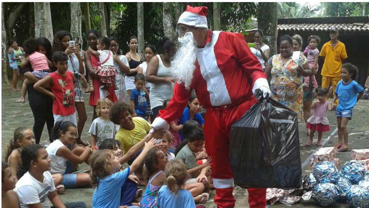
Defesa Civil de Angra leva projeto às escolas

Crianças de escolas distantes da região central, como ilhas e sertão, receberam neste mês de dezembro um Natal mais que especial. A Defesa Civil levou atividades, brinquedos e, é claro, o Papai Noel, a mais de 500