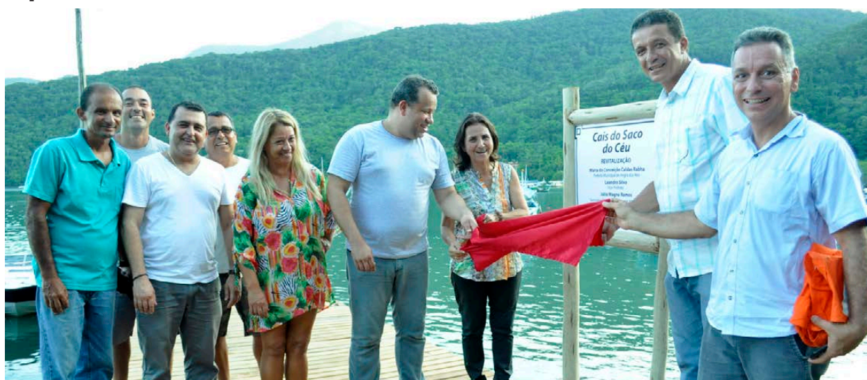
Duas passarelas também foram entregues, totalizando um investimento de aproximadamente R$ 240 mil

do cais de embarque, que fica em frente à igreja católica local, com um total de 38 metros e investimento aproximado de R$ 90 mil; o cais localizado em frente à escola, com 107 metros de