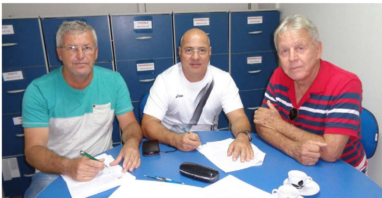
Cerca de 250 famílias serão beneficiadas com a melhoria do abastecimento

N a manhã desta terça-feira, 29, o Serviço Autônomo de Água e Esgoto (Saae) e o Condomínio do Bracuhy assinaram um Termo de Cooperação Técnica, com o objetivo de estabelecer uma parceria para a ampliação do sistema de distribuição e captação de água, bem como a reforma da estação elevatória de captação de água do rio Bracuhy, para atender cerca de 250