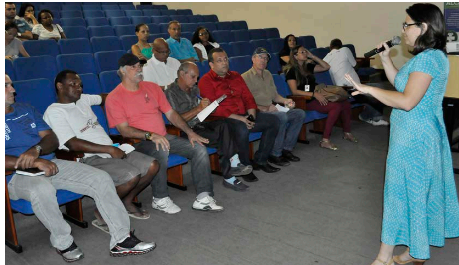
Superintendência de Vigilância em Saúde explicou a forma de combate ao mosquito transmissor

A Prefeitura de Angra dos Reis, por meio da Secretaria de Saúde, realizou na quinta-feira, 17, uma reunião com 18 associações de moradores, no Centro de Estudos Ambientais (CEA) da Praia da Chácara, onde tratou especificamente sobre o combate ao Aedes aegypti , mosquito transmissor da dengue, chikungunya e zika vírus. A Superintendência de Vigilância em Saúde explanou a forma de combate ao mosquito transmissor das doenças.