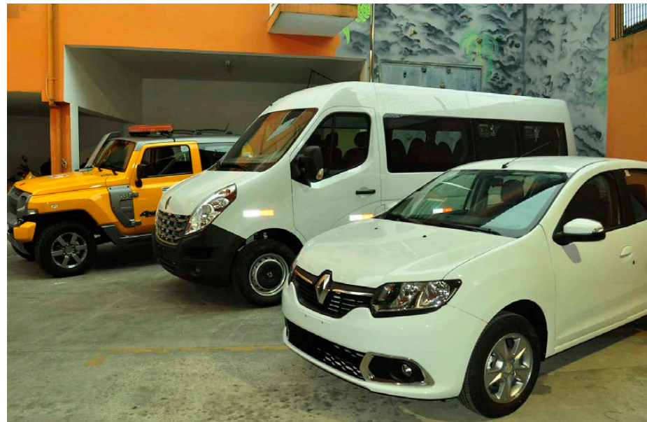
Equipamentos incluem ainda material de informática e são contrapartida da Eletronuclear

R eaparelhamento da Secretaria Especial de Defesa Civil e Trânsito. Esse é o objetivo do convênio firmado entre a instituição e a Eletronuclear, de quase R$ 2 milhões. A entrega dos equipamentos previstos