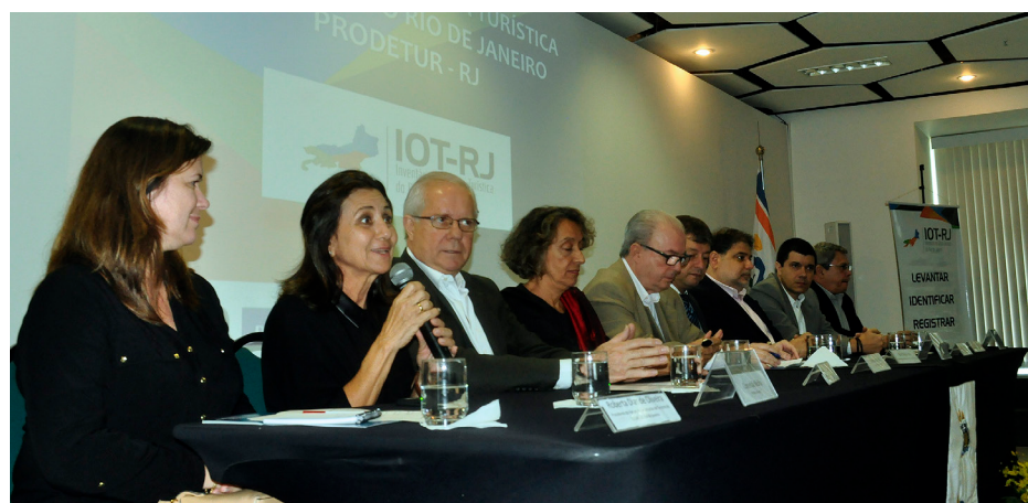
Iniciativa visa capacitar os funcionários da instituição e aperfeiçoar a parte administrativa

Convênio vai mapear atrativos turísticos e infraestrutura dos 23 principais destinos do estado