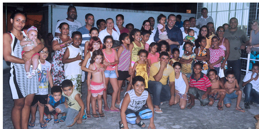
Unidade da Sapinhatuba III deverá ser entregue à população até o final do ano

que a partir do próximo ano os alunos que precisavam se deslocar para outras unidades escolares, fora do bairro, terão mais comodidade para