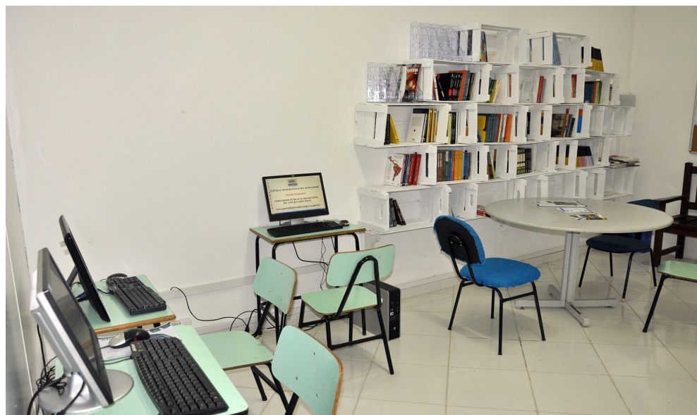
Espaço de estudos e leituras do servidor-público

Computadores para acesso à internet e espaço de leitura já estão disponíveis