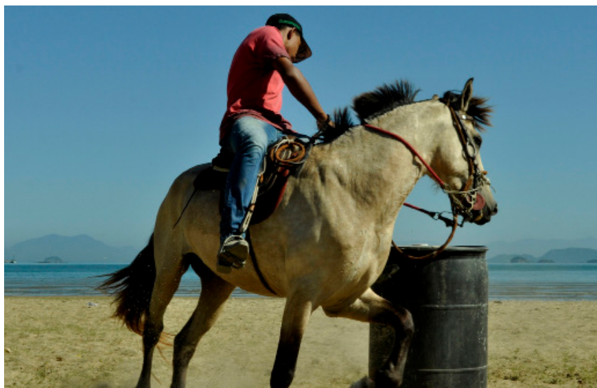
Concurso de cavaleiros foi uma das atrações

O bairro da Monsuaba ficou bastante movimentado no último final de semana com a realização da Festa do Peão, organizada pela associação de moradores (Amam), com apoio da Prefeitura de Angra, Cultuar, Turisangra, órgãos de segurança e comércio local.