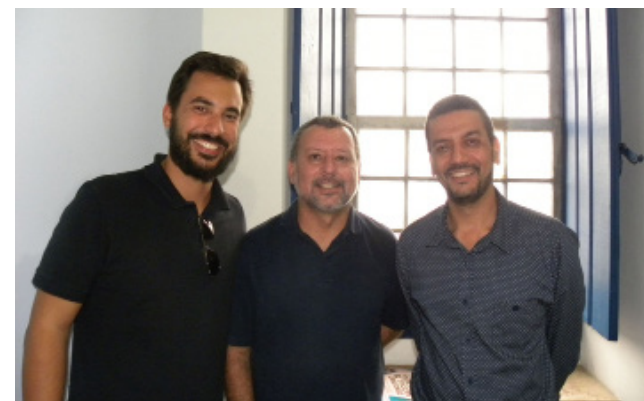
Representantes da TurisAngra comemoram

O revezamento da Tocha Olímpica Rio 2016 é realizado pelo Comitê Organizador dos Jogos Olímpicos e Paralímpicos