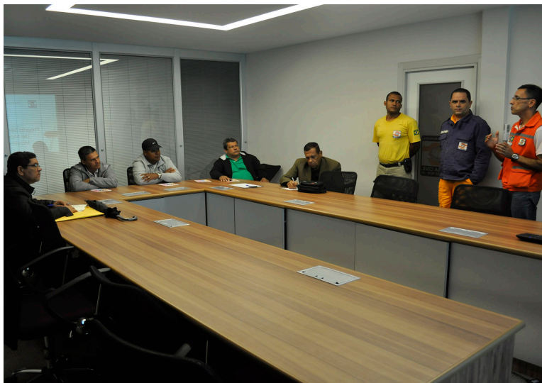
Técnicos e líderes comunitários conheceram o projeto

T écnicos da Defesa Civil municipal reuniram-se nesta quarta-feira, 22, com líderes das associações de moradores das comunidades dos morros do Peres, Carioca, Abel e Monte Castelo, para a apresentação do projeto de monitoramento de encostas, que estará em funcionamento em Angra já no próximo verão. Desenvolvido em parceria com o Centro Nacional de Monitoramento e Alerta de Desastres Naturais (Comaden) do Ministério da Ciência e Tecnologia, o projeto prevê a instalação, em cem pontos espalhados pelo município, de sensores geométricos de movimento de massa (prismas). Esses sensores enviarão a uma