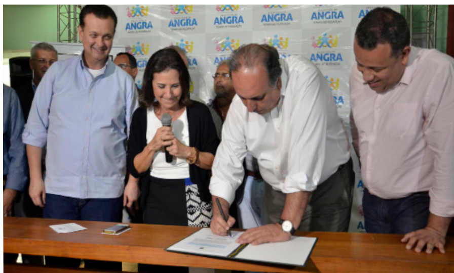
Cerimônia de assinatura aconteceu no Hotel Meliá

A prefeita de Angra, Conceição Rabha, assinou na sexta-feira, 17, com o Ministério das Cidades, a autorização para a contratação de obras de esgotamento sanitário que beneficiarão milhares de moradores do Parque Mambucaba e da Vila Histórica. A verba prevista, de até R$ 39,5 milhões, virá do Programa de Aceleração do Crescimento (PAC 2 - Saneamento). Participaram da solenidade da assinatura da autorização para o convênio, o ministro das Cidades, Gilberto Kassab e o governador Luiz Fernando Pezão, entre outras autoridades.