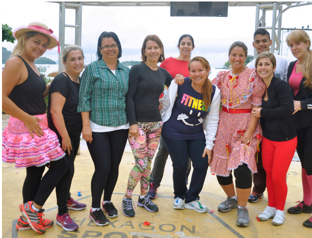
Alunas vieram vestidas a caráter para a festa

Alunas participaram de atividades físicas e de um café da manhã