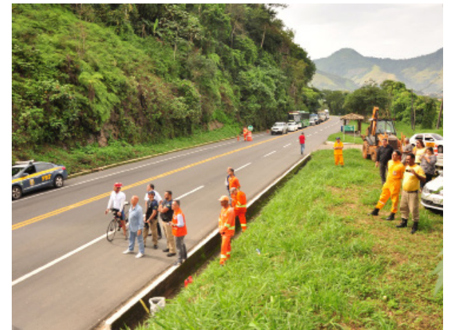
Técnicos da Defesa Civil desobstruíram a pista

Assim que a primeira pedra foi ao chão, os técnicos da instituição identificaram mais três blocos pendurados logo abaixo, que pesavam, no total, cerca de 10 toneladas. A retirada desses outros blocos foi mais rápida. Às 15h, a ação já estava chegando ao fim. A Defesa Civil é um órgão de emergência e atende pelo telefone 199.