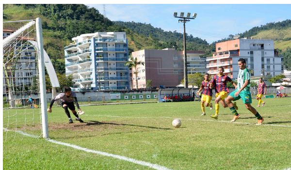
Partida aconteceu no Estádio Municipal

Jogando diante de sua torcida, o Angra venceu as equipes sub-15 e sub-17 do Barcelona-RJ, na tarde de domingo, 21, em jogos válidos pela sétima rodada da segunda divisão do campeonato carioca, das