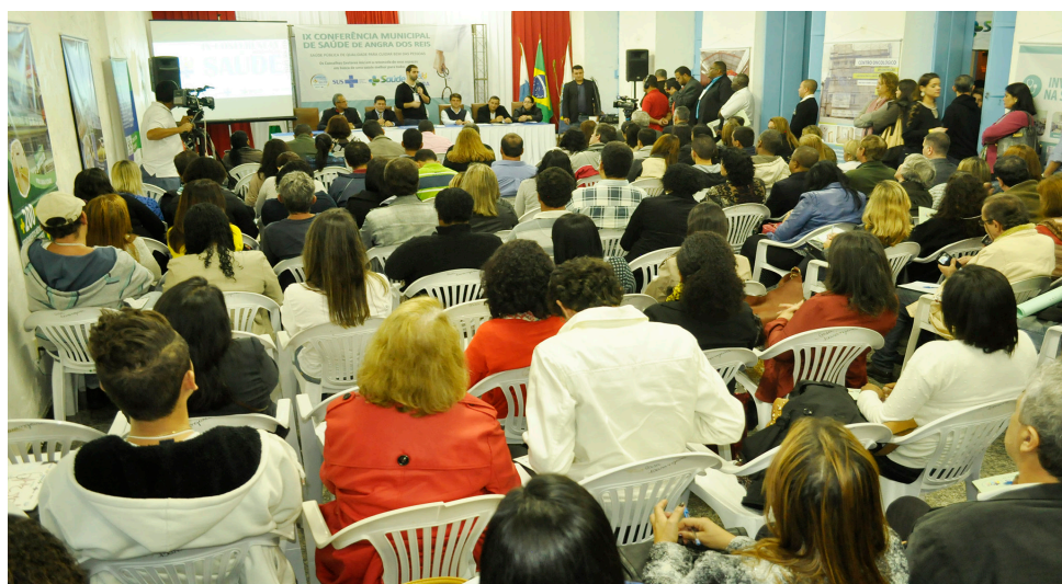
Encontro reuniu representantes do poder público e da sociedade

O Conselho Municipal de Saúde, em parceria com a Prefeitura de Angra dos Reis, realizou no último final de semana, a IX Conferência Municipal de Saúde, que teve como tema “Saúde pública de qualidade para cuidar bem das pessoas: direito do povo brasileiro”. A Conferência elegeu a nova composição do Conselho Municipal de Saúde e também escolheu os delegados que irão representar o município durante a etapa estadual.