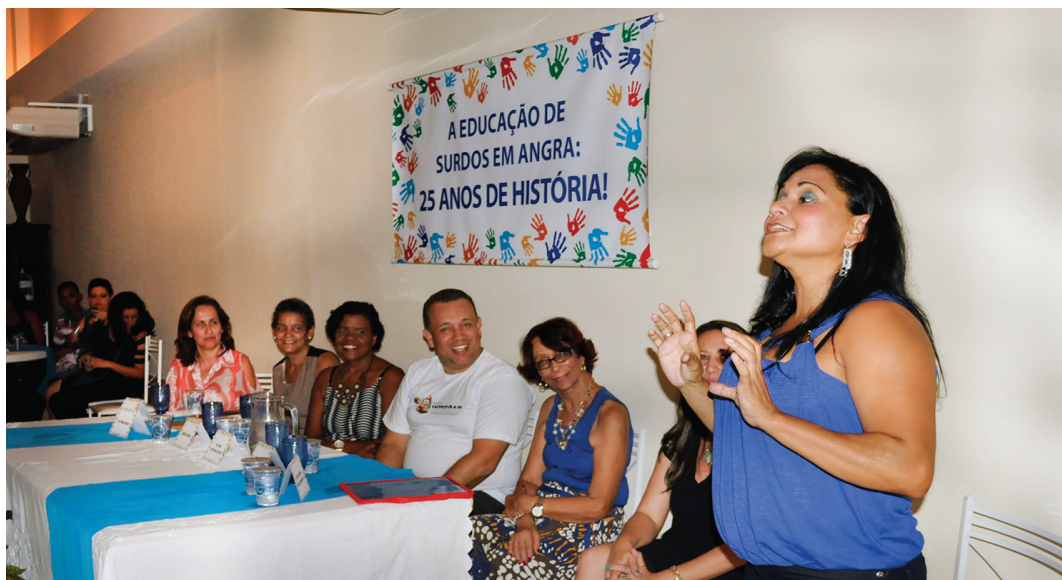
Cerimônia relembrou momentos que marcaram a história da Emes

Especiais (Cemane), fique pronto. Relatos de ex-alunos e ex-profissionais de educação que fizeram parte dessa história foram exibidos em um vídeo, assim como diversas fotos que retratam os 25 anos deste trabalho.