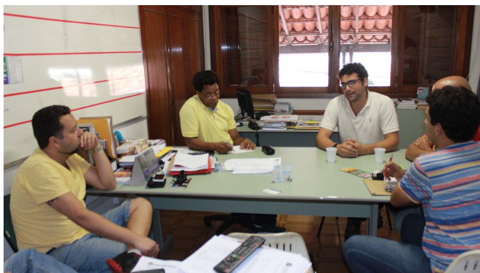
Reunião entre representantes da Cultuar e Inepac

Fundação Cultuar firma parceria com Inepac para catalogar acervo de arte sacra