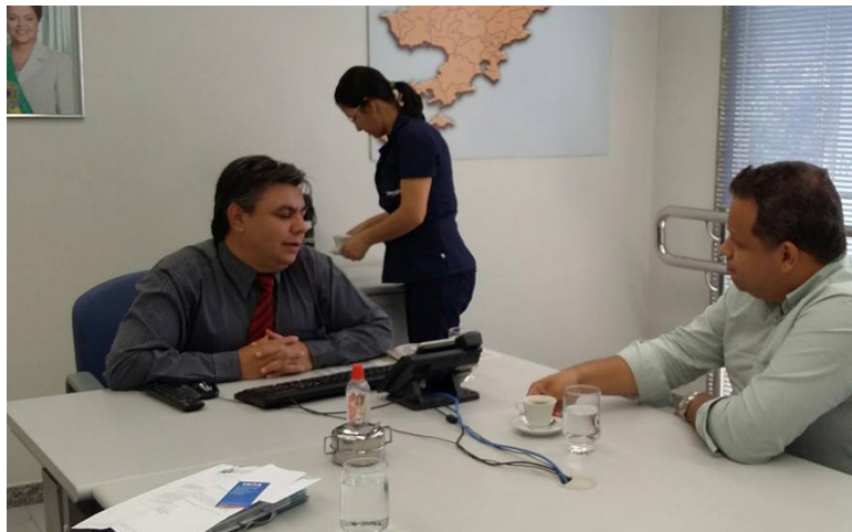
Unidade bancária na Japuíba está sendo avaliada pela Caixa