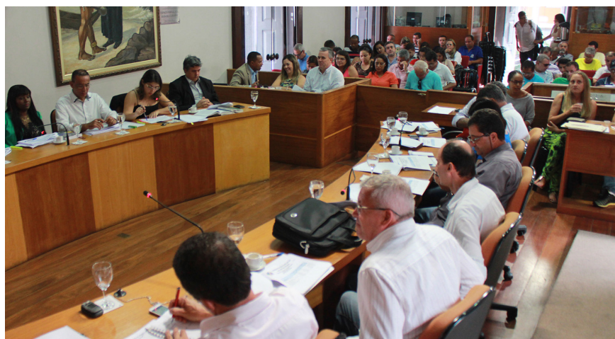
Apresentação foi coordenada pela Controladoria do município

Nesta segunda-feira, 16, a Prefeitura de Angra participou de mais uma audiência de prestação de contas realizada pela Câmara Municipal, em obediência à Lei de Responsabilidade Fiscal. Desta vez, a prestação de contas foi referente ao terceiro quadrimestre de 2014. Foram apresentados os detalhes da execução orçamentária do ano passado, tanto relacionado a despesas como a arrecadação.