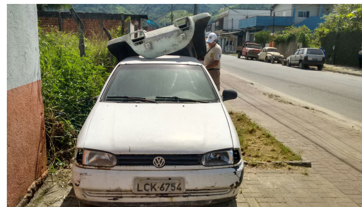
Moradores podem reclamar das carcaças pelo 0800 286 1500

O superintendente reforça a necessidade da ajuda do morador para que a equipe de Coordenação de Fiscalização atue nos bairros. A maioria das vistorias realizadas pelos agentes acontece por pedido via 0800 286 1500.