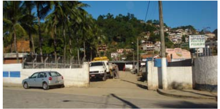
Vista Frontal do Terreno.