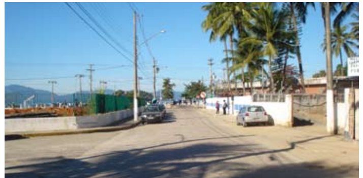
Rua Castelo Branco Esquina com a Álvaro Pessoa