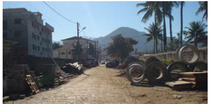
Vista Interior do Terreno