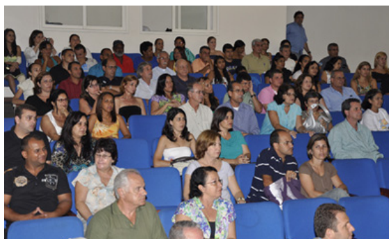
Na plateia, os homenageados e seus familiares