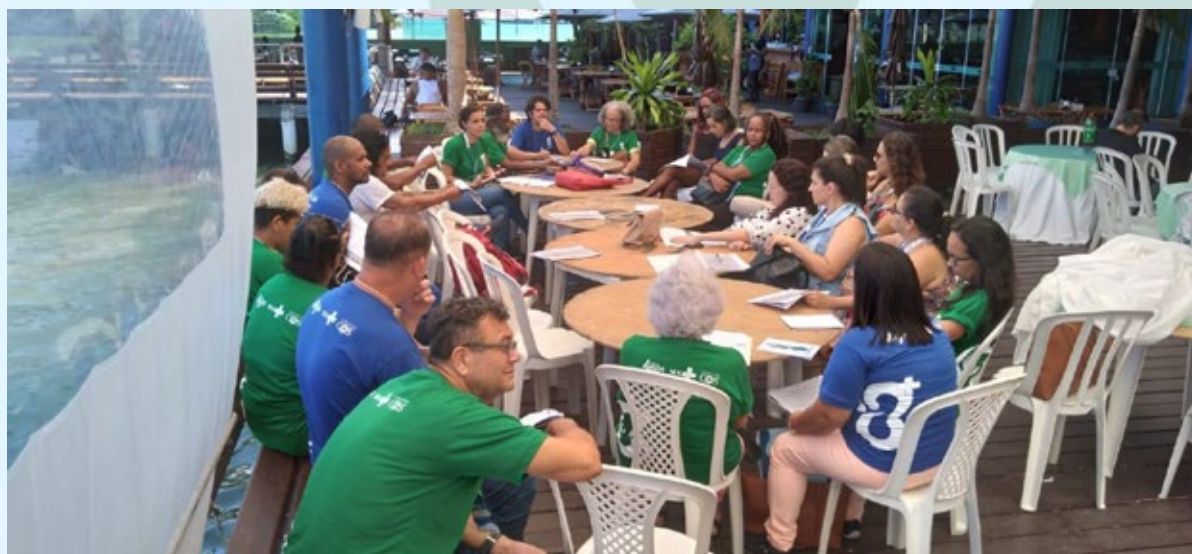
Grupo de trabalho do Eixo 4