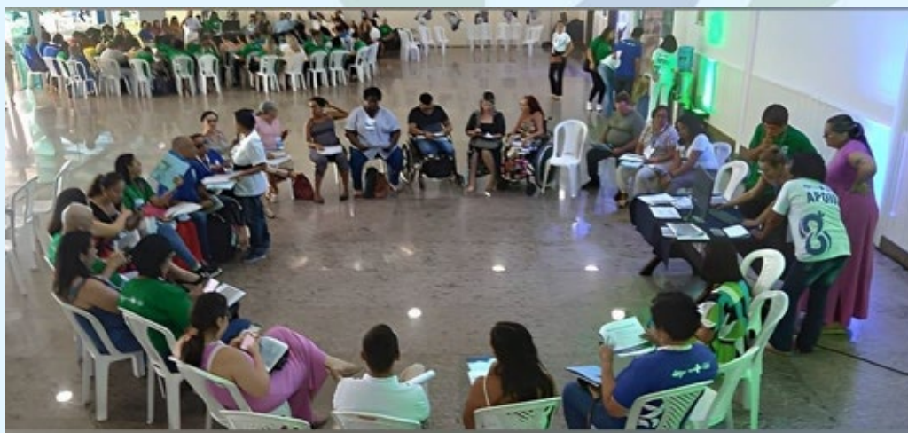
Grupo de Trabalho do Eixo 1.