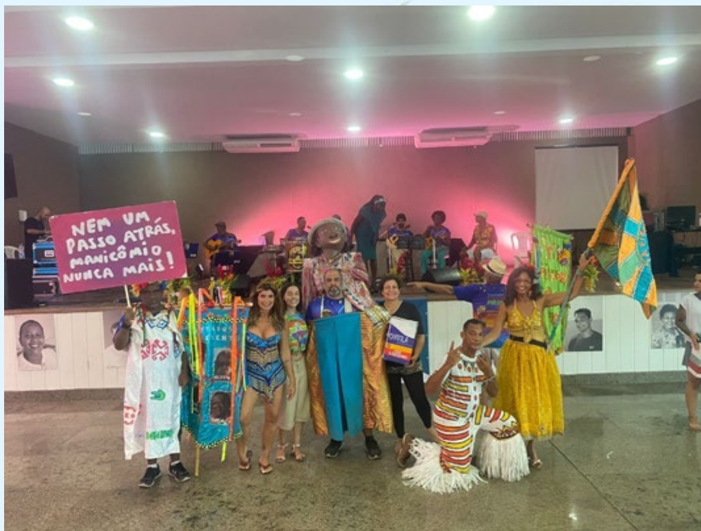
Grupo Pirando, Pirado, Pirou!