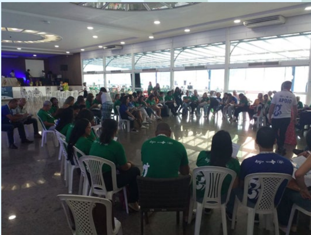
Grupo de Trabalho do Eixo 3.