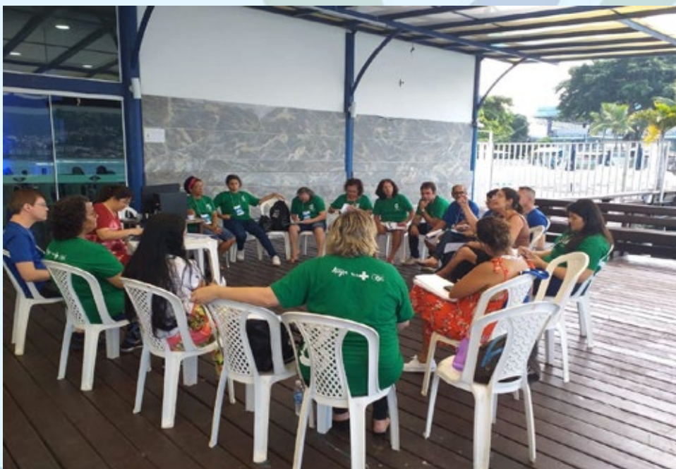
Grupo de Trabalho do Eixo 2.

3 - Regulamentar as Leis do controle social (iniciando pela Lei Federal nº 8.142/1990) buscando sanções para os gestores pelo não cumprimento das deliberações dos Conselhos e não incorporação de Diretrizes e propostas das Conferências de Saúde na elaboração de instrumentos de planejamento como forma de garantir sua efetividade.