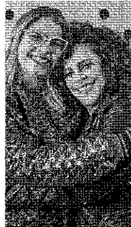
Marília Mendonça e Gal Costa

"A música que gravamos juntas fala de um amor não correspondido, mas eu quis cantar de maneira alegre e dançante, para seguir a sonoridade do álbum. Quando eu disse que gravávamos juntas, ouve uma reação contra e algumas pessoas não gostaram. Mas acontece que eu vi nela uma cantora muito sin-