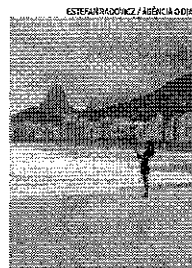
Praias ficaram vazias ontem

Após dias ensolarados, o tempo começou a mudar bastante na cidade do Rio, ontem, com a chegada de uma nova frente fria. O dia amanheceu nublado e com muitas nuvens, apresentando chuva fraca em pontos isolados da capital, como nos bairros de Guaratiba, e Recreio dos Bandeirantes, na Zona Oeste. Com a chegada da frente fria, o clima dos próximos dias deve oscilar entre nublado e parcialmente nublado, com alguns momentos de aparição do sol. De acordo com informações do Alerta Rio, hoje a cidade deverá ter chuva fraca durante a manhã, com um declínio ainda maior de temperaturas, sendo a mínima de