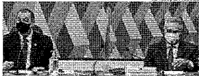
Senadores Omar Aziz e Renan Calheiros comandando a CPI da Covid

O senador Renan Calheiros (MDB-AL), relator da CPI da Covid, declarou, ontem, que se “houver provas sobre os mortifícios”, autoridades serão punidas e responsabilizadas pela crise sanitária acarreata pela pandemia, que deixou mais de 400 mil mortos no Brasil. “Os fatos falam por si (...). O Brasil virou o cemitério do mundo. O fato de terem transformado o Brasil nisso não ficará impune. Seria a desmoralização de todos nós da CPI”, afirma. O responsável pela relatoria da Comissão rebateu supostas declarações do Palácio do Planalto que acreditavam que as investigações “não vão dar em nada”. “Se houver provas sobre os mor-