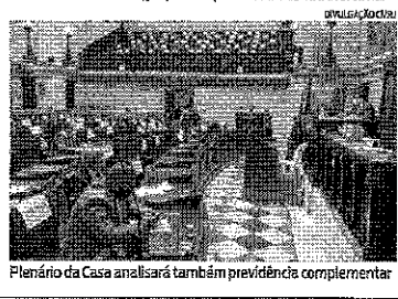
Plenário da Casa analisará também previdência complementar

Enquanto dentro do Palácio Pedro Ernesto os vereadores estão debatendo as medidas, do lado de fora as categorias participam de ato contra a reforma.