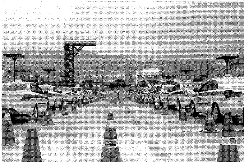
Táxis em registro de junho de 2020, durante teste contra a covid; categoria agora vê a exigência da vistoria ser suspensa até 31 de dezembro

“O prefeito Eduardo Paes e eu sabemos que a vida está difícil para vocês. Eu me comprometi a apresentar algum tipo de suspensão para tirar esse custo pesado para o taxista, não apenas a taxa, mas também o custo de emissão de certidões, atualização do seguro individual de passageiro e todos os custos envolvidos na vistoria anual. Acredito que seja decisivo para aliviar a classe nesse momento a criação desse mecanismo pela Prefeitura”, disse.