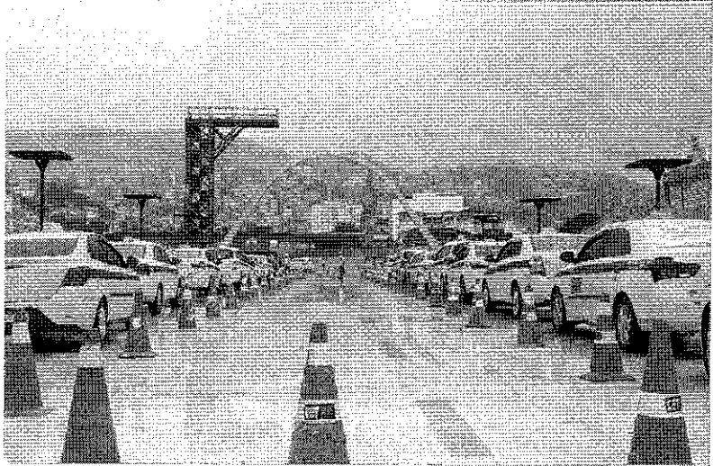
Táxis em registro de junho de 2020, durante teste contra a covid; categoria agora vê a exigência da vistoria ser suspensa até 31 de dezembro

esse custo pesado para o taxista, não apenas a taxa, mas também o custo de emissão de certidões, atualização do seguro individual de passageiro e todos os custos envolvidos na vistoria anual. Acredito que seja decisivo para aliviar a classe nesse momento a criação desse mecanismo pela Prefeitura", disse.