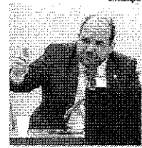
Sargento Gurgel destaca artigo

Em discurso na Câmara, o deputado federal Sargento Gurgel (PSL) fez referência a um artigo escrito pelo colunista de O Dia, Nuno Vasconcellos, em sua coluna "Um Olhar Sobre o Rio", publicado no dia 14 de fevereiro de 2021. No artigo "Um Plano Estratégico para o Rio", Nuno afirma que o Rio precisa de uma "ação firme e coordenada para se livrar do entulho acumulado após anos de má fé ou de incompetência dos seus governantes", e que as principais lideranças políticas, sociais e empresariais precisam encontrar-se para "resolver os problemas que ameaçam a segurança do estado e do município".