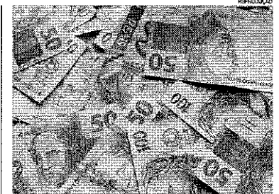
Entrega começa amanhã para moradores da Região Metropolitana