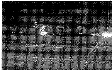
Acidente com ônibus provocou um incêndio, que atingiu uma casa

Durante a manhã, quem passava pelo local pôde ver as marcas deixadas pelo acidente.