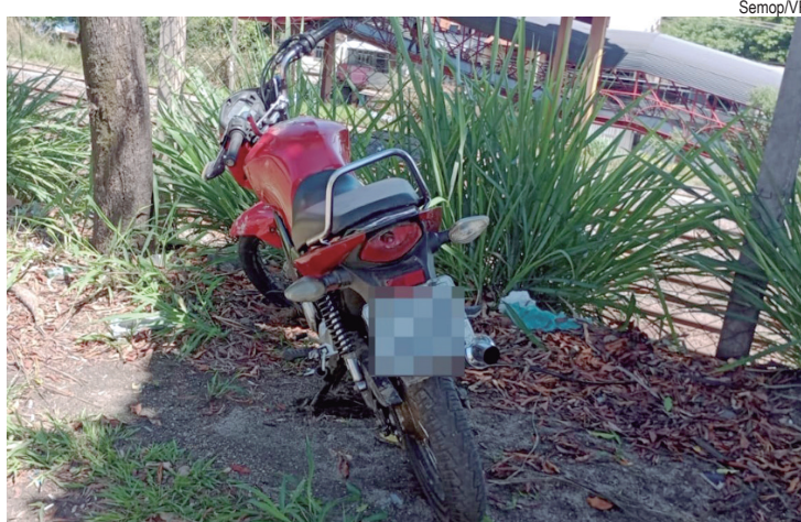
Moto foi encontrada abandonada às margens da Lúcio Meira

O secretário também ressaltou o impacto do projeto “Aliados da Segurança Pública”, que conta com mais de dez mil pessoas cadastradas. “É um serviço que tem funcionado muito bem, trazendo proximidade e resgatando a confiança da população no trabalho