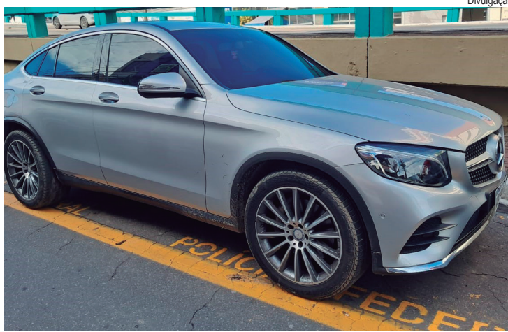
Dois carros de luxo foram apreendidos em Barra Mansa

As fraudes envolvem o uso da técnica conhecida como 'Injection', onde informações de biometria facial e dados pessoais de terceiros são validados em sistemas bancários e de instituições financeiras para obtenção de financiamentos veiculares, sem que os verdadeiros