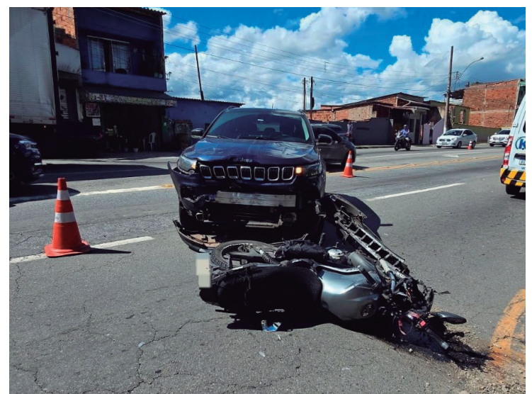
Condutor da moto ficou ferido e foi conduzido ao Hospital São João Batista