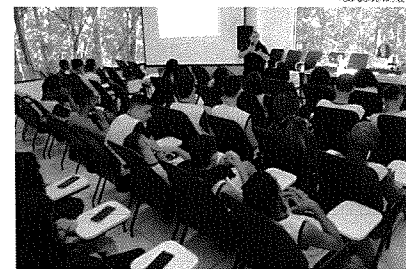
Os alunos do desenvolvimento sustentável em 2023, em um encontro no Parque de Saúde.