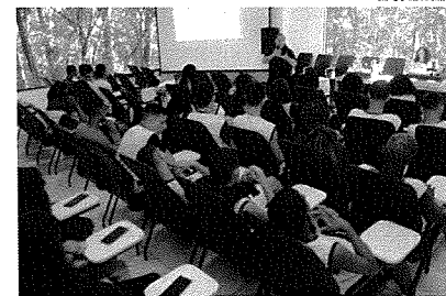
Os alunos desenvolveram o projeto em 2023, em sistema no Parque de Saúde