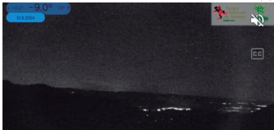
Parque Nacional do Itaitiaia registrou temperaturas negativas

mínima cairá para 8°C, com máxima prevista de 20°C. Em Barra Mansa, o clima será semelhante ao de Volta Redonda, com mínima de 10°C e máxima de 24°C na segunda-feira. Na terça-feira, a mínima deve ser a mesma, de 8°C, enquanto a máxima será ligeiramente menor, 20°C. Em Resende, as temperaturas baixam um pouco mais. Na segunda-feira, a mínima será de 9°C e a máxima de 24°C. No dia seguinte, a mínima deve cair para 7°C e a máxima para 19°C.