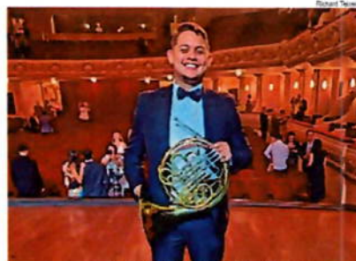
Apresentação será às 19h, na Sala da Orquestra Sinfônica de Barra Mansa.