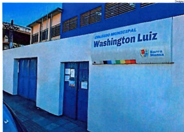
Matrículas deverão ser realizadas na secretaria da escola, localizada no bairro Saúde, em Barra Mansa.