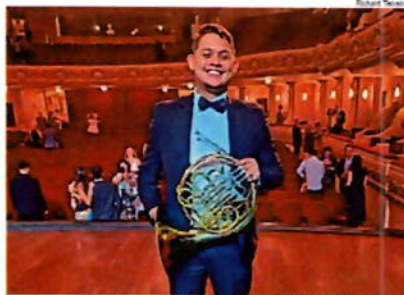
Apresentação será às 19h, na sala da Orquestra Sinfônica de Barra Mansa.