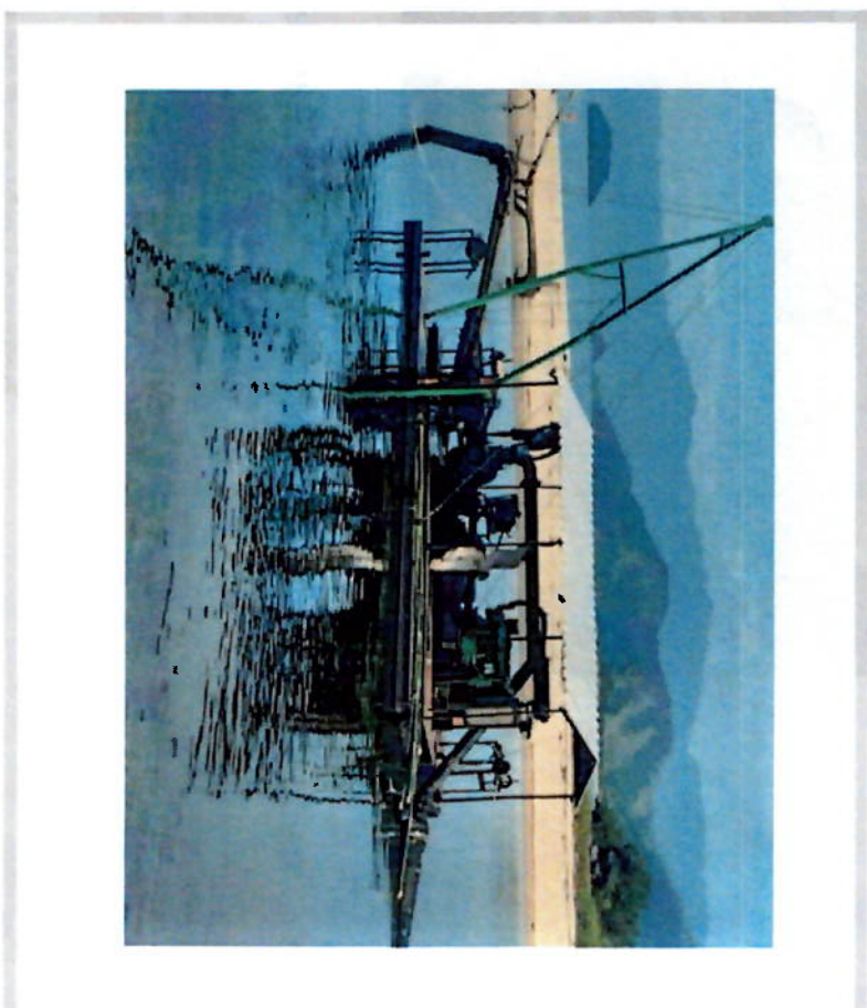
DESASSOREAMENTO DA FÓZ RIO MAMBUCABA, VILA HISTÓRICA DE MAMBUCABA. EQUIP. - ESCAVADEIRA HIDRAULICA / BALSA