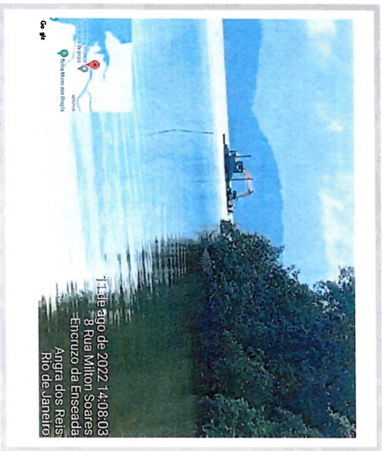
DESASSOREAMENTO DO RIO DO MEIO, JAPUÍBA EM SUA FOZ, VILA NOVA. EQUIP. – ESCAVADEIRA HIDRAULICA / BALSA