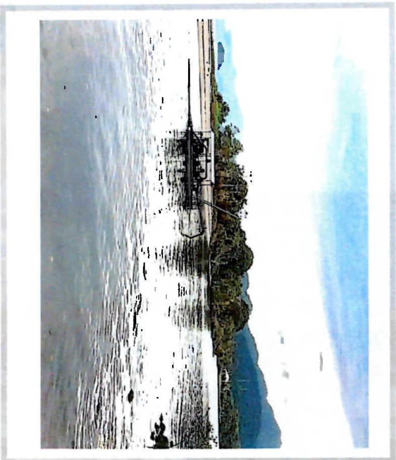
DESASSOREAMENTO DA FÓZ RIO MAMBUCABA, VILA HISTÓRICA DE MAMBUCABA. EQUIP. - ESCAVADEIRA HIDRAULICA / BALSA

AÇÕES DE LIMPEZA, DESASSOREAMENTO E MANUTENÇÃO DO RIO MAMBUCABA, VILA HISTÓRICA DE MAMBUCABA (CONTINUAÇÃO)