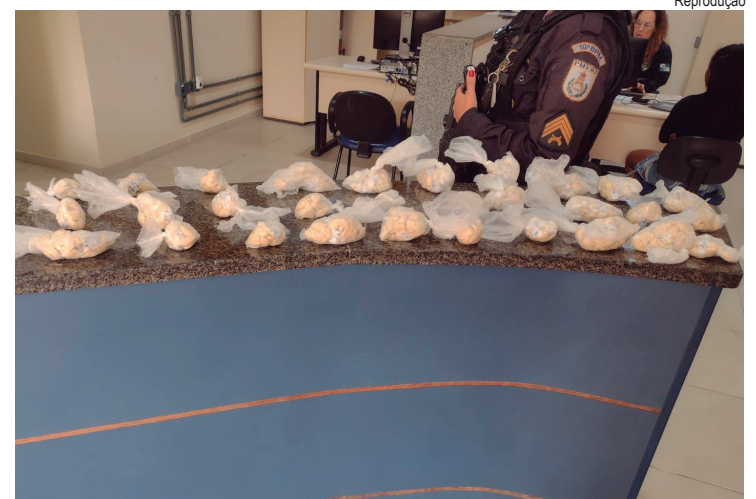
Drogas foram levadas para a 91ª Delegacia de Polícia