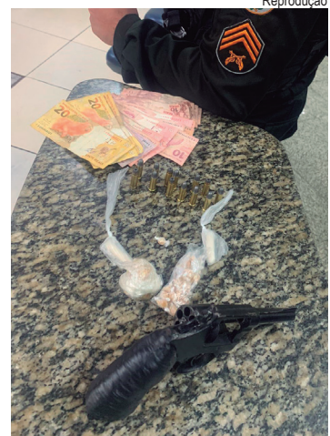
Revólver encontrado pertenceria a outro homem, não foi localizado

Na unidade, descobriu-se que havia contra um deles um mandado de prisão em aberto por débito de pensão alimentícia. O casal foi ouvido e liberado. Os outros homens foram autuados por tráfico de drogas e permaneceram presos. Durante o depoimento, um deles disse que o revólver encontrado pertencia a seu filho, que não estava presente no momento das buscas e não foi encontrado. Embora não tenha sido localizado, ele foi enquadrado por posse ilegal de arma de fogo.