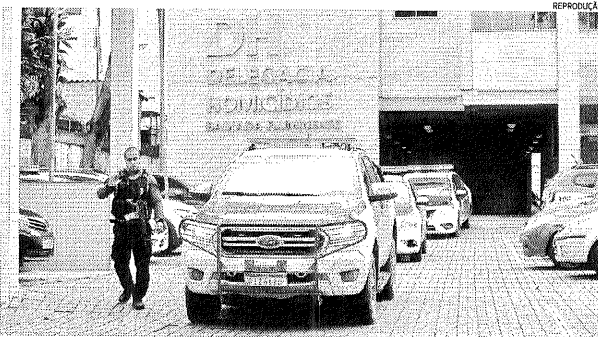
Investigações sobre a troca de tiros e autoria do disparo que matou jovem em Belford Roxo estão com a DHBF

A tia da vítima, que preferiu não se identificar, relatou que estava trabalhando e ouviu disparos na região. Entretanto, a família só soube que a adolescente havia sido atingida depois que ela foi encaminhada para o Hospital Municipal de Belford Roxo e acabou morrendo.