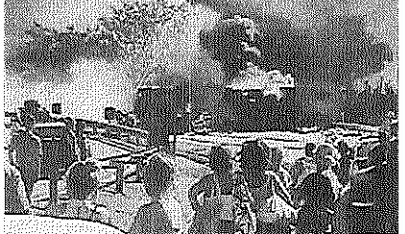
Carreta pegou fogo após tomba em trecho da Rodovia BR-101

A empresa informou que o motorista do veículo, que não teve a identidade revelada, ficou levemente ferido e recebeu atendimento médico da equipe, sendo liberado ainda no local. Bombeiros e agentes da Polícia Rodoviária Federal (PRF) também atuaram na ocorrência. O tombamento bloqueou totalmente a pista.