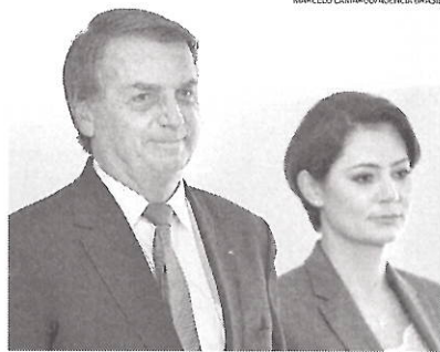
Jair Bolsonaro (PL) e a sua esposa, Michelle, ficaram em silêncio

ram crime de lavagem de dinheiro e peculato (apropriação de patrimônio público), passíveis de prisão. Jair e Michelle Bolsonaro "optam pela prerrogativa do silêncio no tocante aos fatos ora apurados", diz o documento apresentado pela defesa do casal à polícia, de acordo com a imprensa. Os advogados alegaram que seus clientes não foram convocados pela autoridade devida, portanto, decidiram "não fornecer declarações adicionais até que estejam diante de um Juiz Natural competente". No total, on-