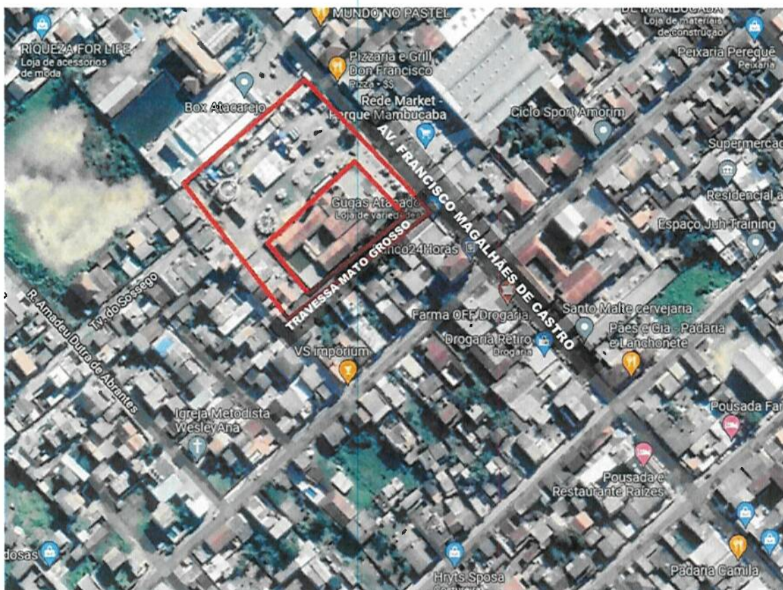
Figura 01. Área do projeto – Av. Francisco Magalhães de Castro

O projeto em questão está localizado em um terreno no bairro Parque Mambucaba, na cidade de Angra dos Reis/RJ, sendo o seu principal acesso pela Avenida Francisco Magalhães de Castro e acesso secundário pela Travessa Mato Grosso. Como referência para a área destacada (ponto central da poligonal vermelha na figura 01) é apresentada a seguinte coordenada: Latitude 23°01'02.9" S e Longitude 44°32'12.9" W.