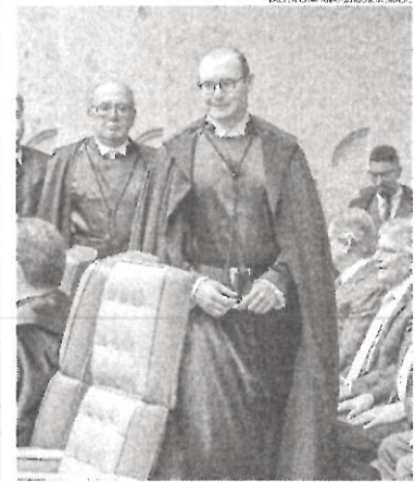
Cristiano Zanin chega para assumir cadeira como ministro do STF