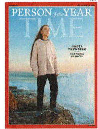
Greta na capa da Times

Bolsonaro voltou a chamar ontem a ativista sueca Greta Thunberg de "pirralha" e a associar o ator Leonardo DiCaprio como su-